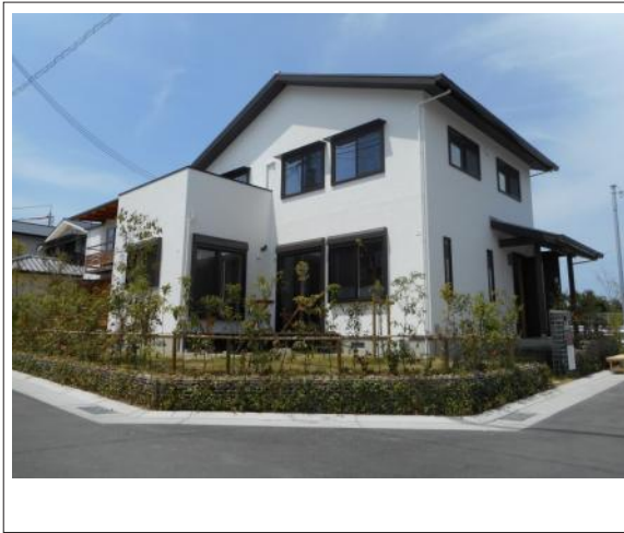
写真 東側からの外観です。