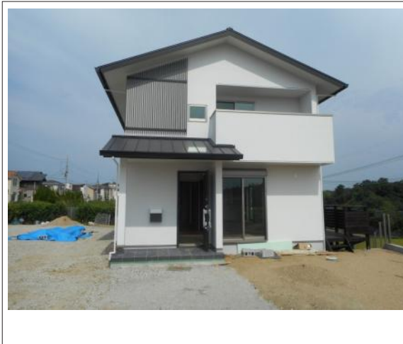
写真 南東側から見た外観です。